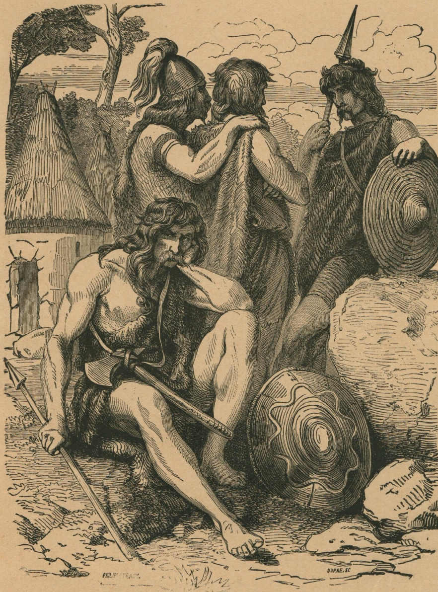
14. — Types gaulois. Gallische typen.